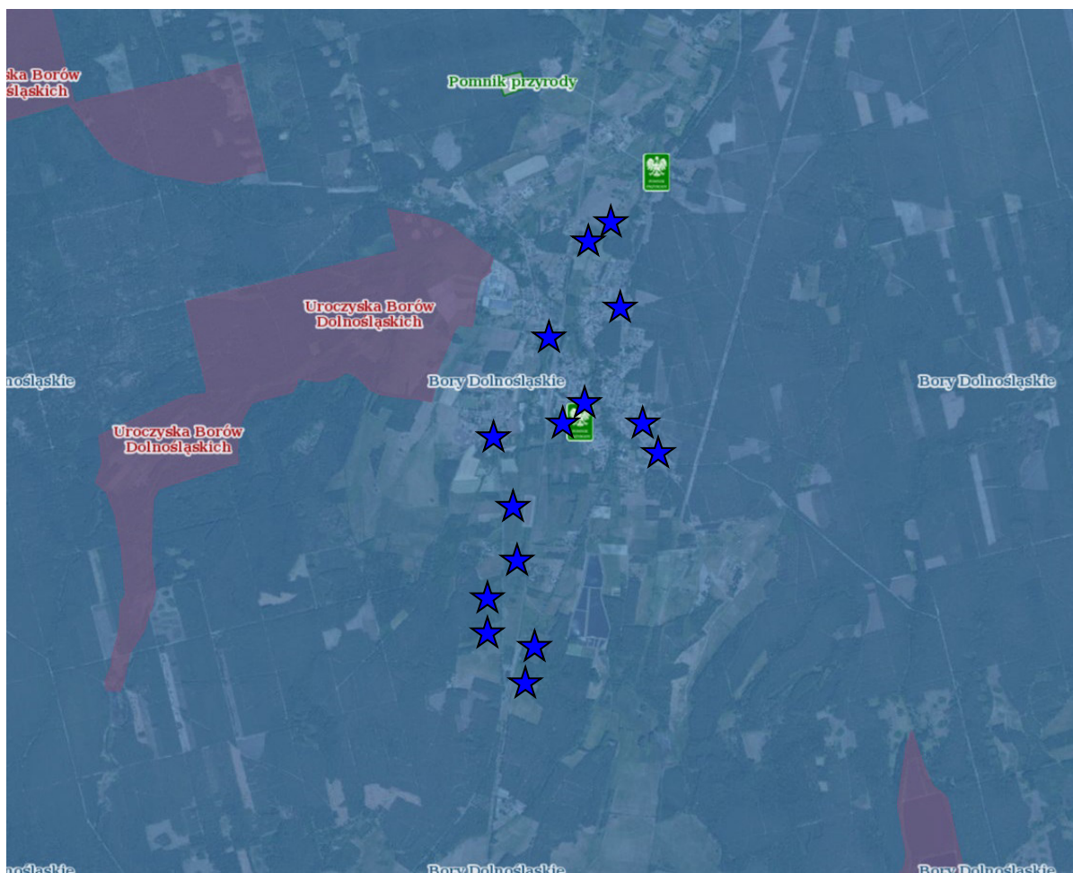
Ryc. 2. Położenie obszaru opracowania na tle obszarów sieci NATURA 2000.